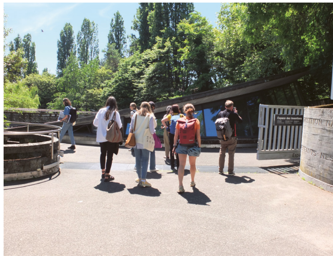
Visite chez Ville en tête à Lausanne avec la «Table ronde sur l'enseignement à la culture du bâti en Suisse». Promenade en commun dans la Vallée de la Jeunesse, ici devant l'Espace des Inventions, juin 2024.

L'espace public est une institution fondamentale de la société démocratique. L'espace public est un espace pour toutes et tous.