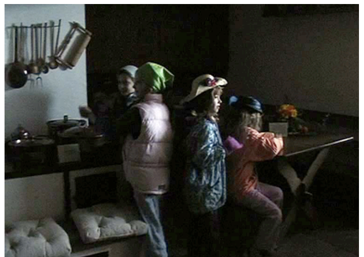
Ein paar Mädchen spielen eine Szene in der Küche nach. Sie lernen dabei, welche verschiedenen Tätigkeiten die Mägde dort zu erledigen hatten.

Die Geschichte eines Hühnerdiebs zeigte einerseits auf, dass lebende Hühner in der Küche waren und leitete andererseits über zum Verlies. Im Salon erfuhren wir neben vielen anderen Aspekten, dass dieser Raum mit einem Cheminee beheizt wurde und mit einem Kerzenleuchter beleuchtet. Die Kinder mussten die Kerzen zählen, da die Magd weder lesen und schreiben noch zählen konnte. Zwischen den einzelnen Räumen gab es ein System von Drähten, welche jeweils zu Glöckchen in den Räumen führten. Damit konnten die BewohnerInnen die Magd rufen. Das Mägdezimmer war zugleich Kinderzimmer - die Babys und Kleinkinder wurden von den Mägden betreut. Im Festsaal wurde eine Szene des Verlobungsfestes vom Vortag nachgestellt. Nach Bibliothek und Billardraum endete der Umgang im Dachboden, wo die Kinder herumrennen durften um die Holzschachtel zu suchen.