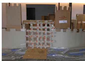
Das fertig gebaute Burgtor vor der Bemalung (links) und dieselbe Ansicht auf die vollends geschmückte Burgmauer (rechts)