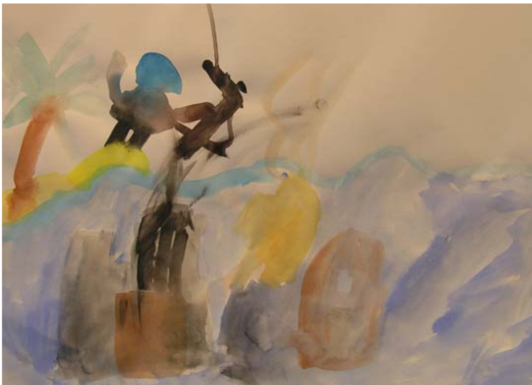
links: Die Kinder besichtigen den mittelalterlicher Obertorturm. oben: Mit Wasserfarben geben sie ihren Vorstellungen Ausdruck.