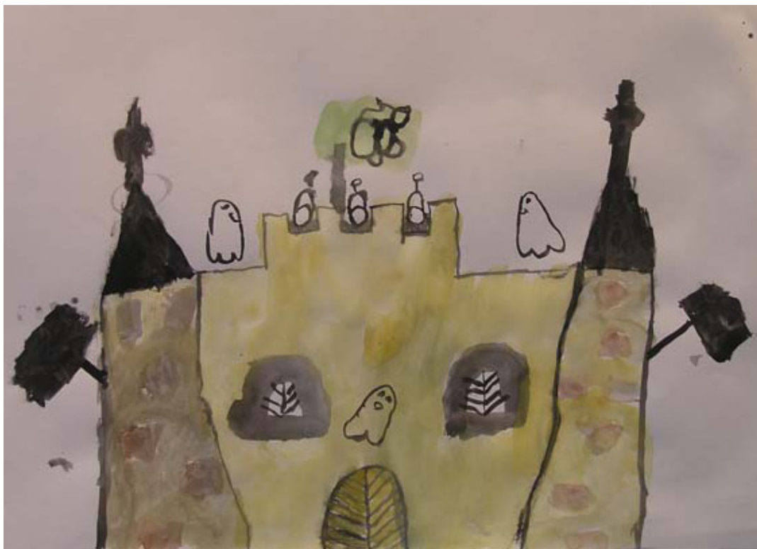
Die Detailliertheit in vielen Zeichnungen zeigt, wie aufmerksam die Kinder beobachten und sich Einzelheiten einprägen: die Beschaffenheit des hölzernen Eingangstors, Eisengitter und Fallgatter, Giebel und Zinnen der Wehrtürme.