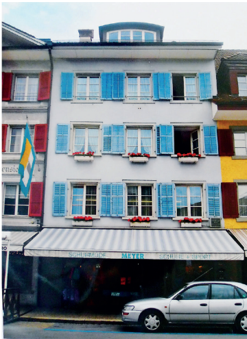
Farbsafari Fassade (Bild: Lehrmittel «Bauten, Städte, Landschaften»)