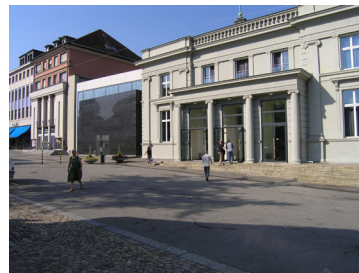
Kultur- und Kongresszentrum (KuK)