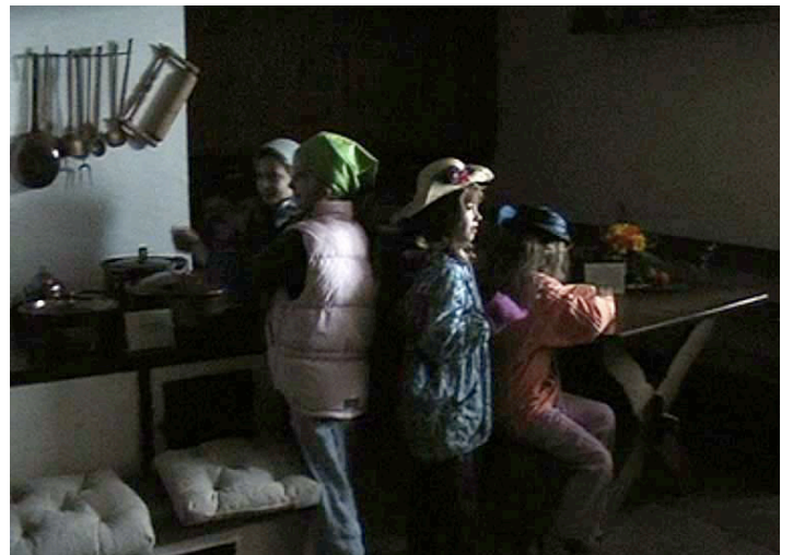
Quelques enfants jouent une scène dans la cuisine. Ils et elles apprennent ainsi les différentes tâches que les servantes devaient y accomplir.

L'histoire d'un voleur de poules montra d'une part que des poules vivantes se trouvaient dans la cuisine et permis en outre de faire la transition avec le cachot. Dans le salon, nous avons appris, parmi de nombreux autres aspects, que cette pièce était chauffée par une cheminée et éclairée par un chandelier. Les enfants durent compter les bougies, car la servante ne savait ni lire, ni écrire, ni compter. Entre les différentes pièces, il y avait un système de fils qui menaient chacun à des clochettes dans les pièces. Les habitant-es pouvaient ainsi appeler la servante. La chambre des servantes était également la chambre des enfants – les bébés et les jeunes enfants étaient gardés par les servantes. Dans la salle des fêtes, une scène de la fête de fiançailles de la veille avait été reconstituée. Après la bibliothèque et la salle de billard, la visite se termina au grenier, où les enfants purent courir dans tous les sens à la recherche de la boîte en bois.